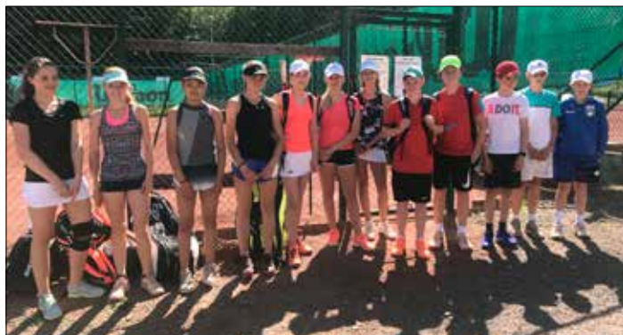
Tennisens tävlingsgrupp på Båstadsläger