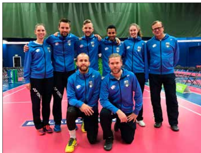
Badmintonligalaget inför seriematch