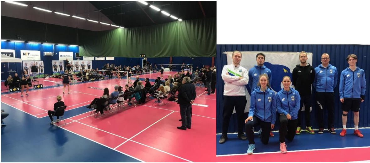
Hemmamatch i Badmintonligan med PTBK:s A-lag på bild.

Eftersom vårt A-lag i badminton spelar i Badmintonligan har vi också haft VIP-träffar inför våra hemmamatcher i våras då vårt A-lag gick till SM-final. I publiken har det varit cirka 200 personer vilket har varit väldigt roligt. VIP-träffarna fortsatte under hösten då vårt A-lag vann grundserien.