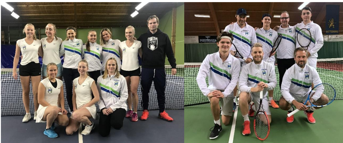
Våra A-lag i tennis.

Vi arrangerade också VIP-träffar i samband med att våra båda A-lag i tennis spelade division 1 i höstas. Både herrarna och damerna slutade fyra i sina division 1-serier, vilket är näst högsta serierna i tennis-Sverige.