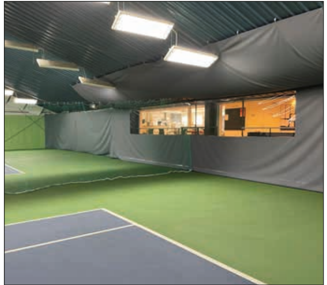
Nya ljuddämpande skycken har satts upp på tennisens bana 1 och 2.