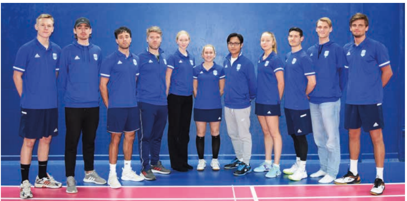
A-laget i badminton inför match i Badmintonligan.