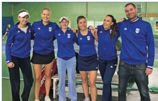
Damernas A-lag i tennis spelar elitserien till hösten.