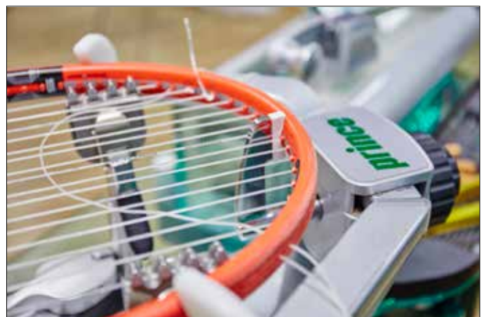
Både tennis- och badmintonracketar kan strängas av personalen i PTBK:s reception.