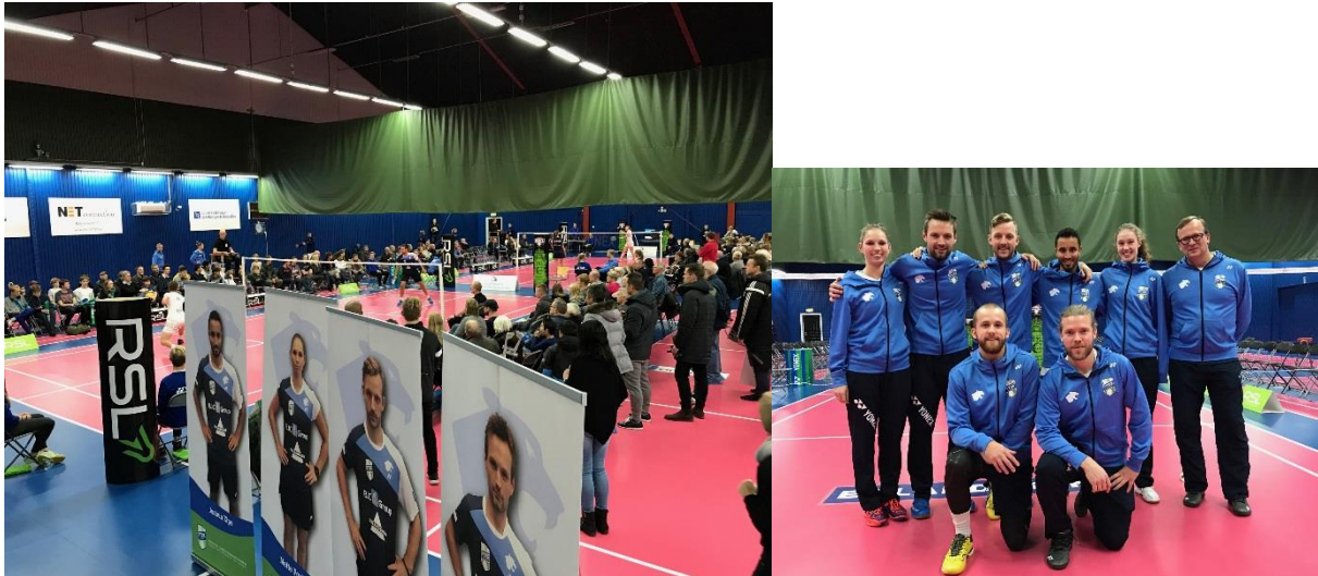
Hemmamatch mot Fyrisfjäders i Badmintonligan med PTBK:s A-lag på bild.

Eftersom vårt A-lag i badminton spelar i Badmintonligan har vi också haft VIP-träffar inför våra båda hemmamatcher mot Frölunda och Fyrisfjäders, Uppsala, i oktober respektive november. I publiken har det varit cirka 250 personer vilket har varit väldigt roligt. Vårt A-lag har dessutom spelat väldigt bra och är med i den absoluta toppen av Badmintonligan där det nästa gång blir toppmatch mot Halmstad 15 januari 2019 i PTBK-hallen.