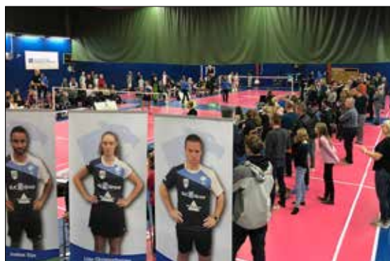
Hemmamatch i Badmintonligan