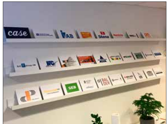
Partnerskyltar i kafét