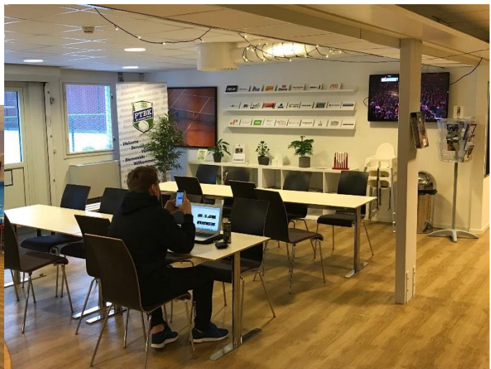
De små partnerskyltarna i kafét.