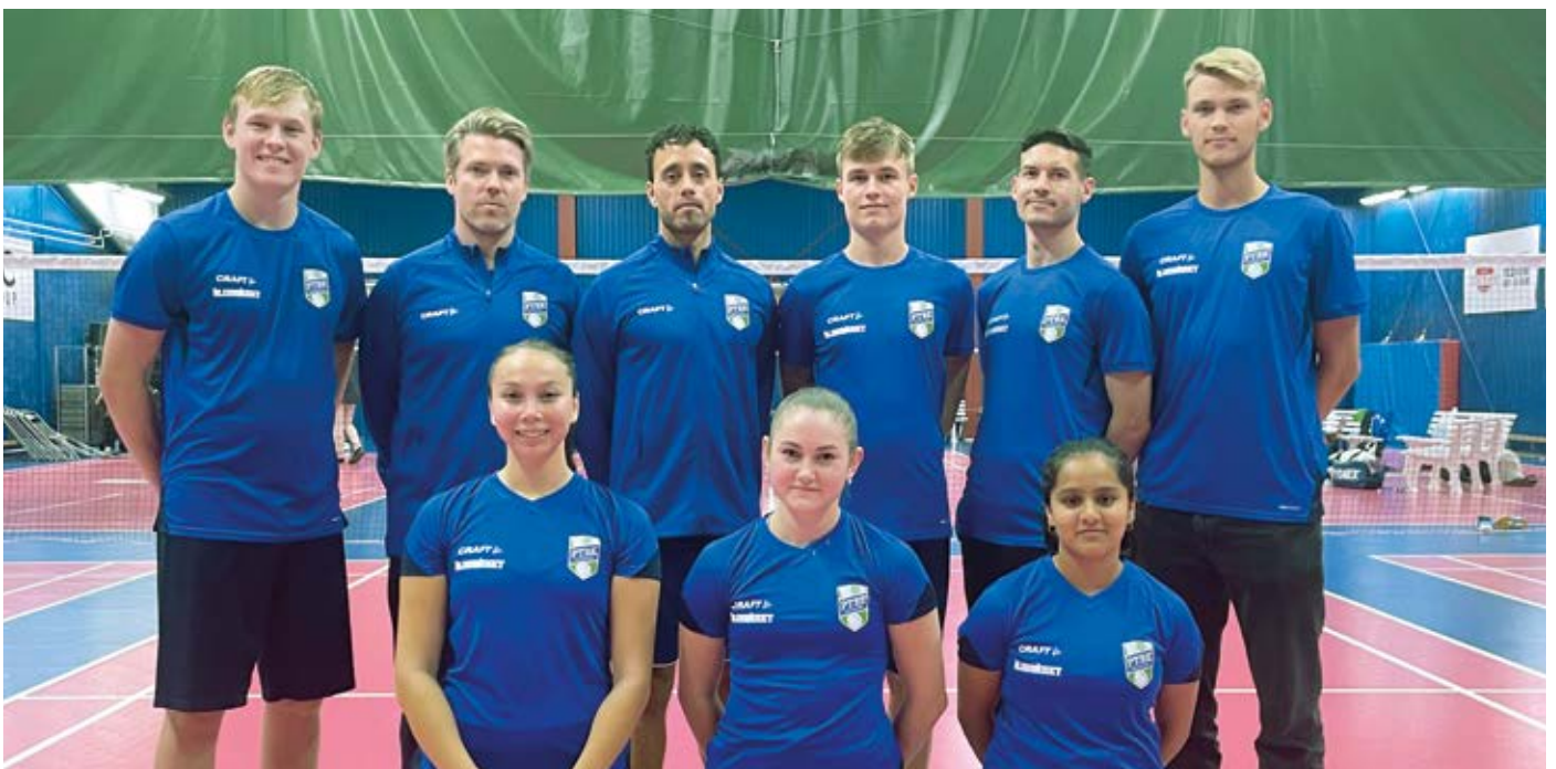
A-laget i badminton inför match i Badmintonligan.