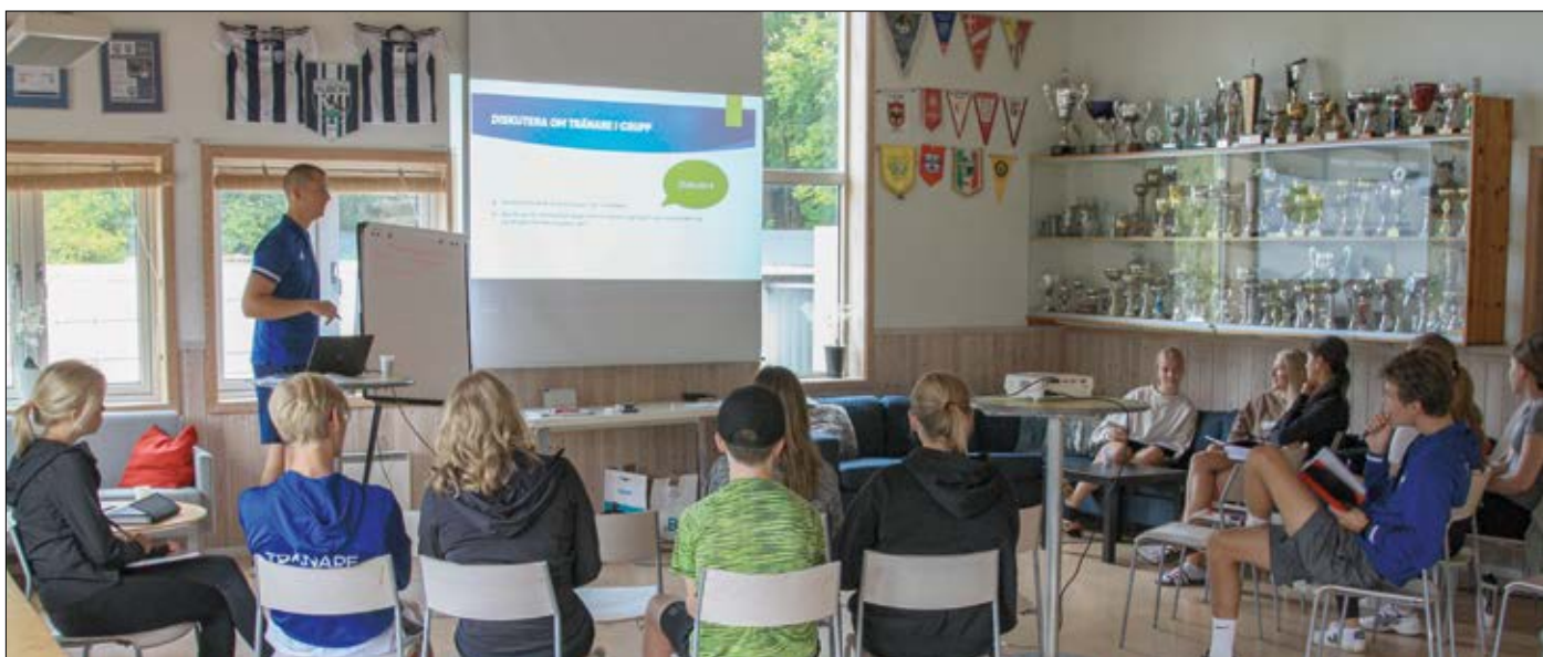
Tennisens interna utbildning för tränare i augusti.