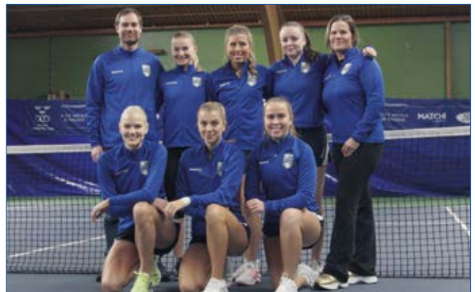
Damernas A-lag i tennis gick till SM-final.