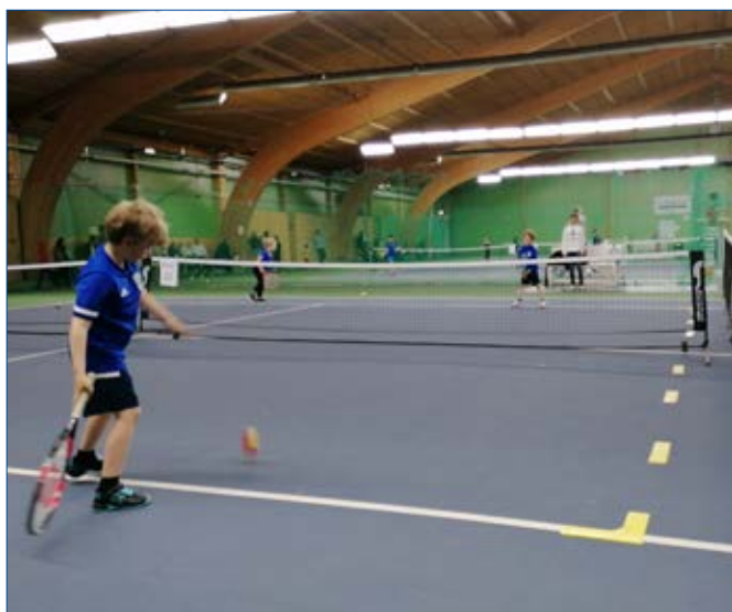
Minitenniscup, en social aktivitet.