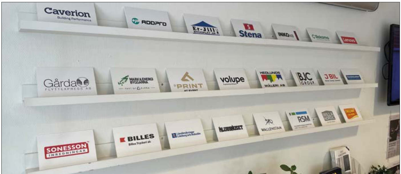
Partnerskyltar i kafé