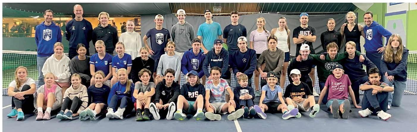
Träning inför elitserien med PTBK:s bollkallar, linjedomare, huvuddomare, spelare och tränare.

Huvudinriktning: Att erbjuda en utvecklande och inspirerande träning i en engagerande miljö.