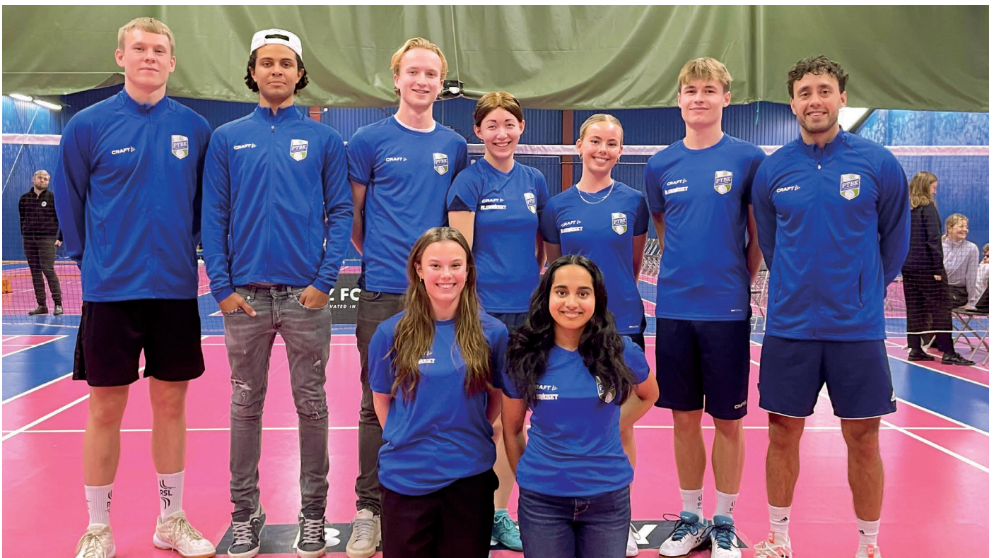
A-laget i badminton inför match i Badmintonligan.