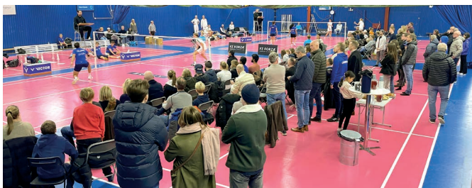
Publik på en av PTBK:s matcher i Badmintonligan.