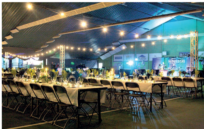
PTBK firade stor 40-årsfest i oktober i hallen