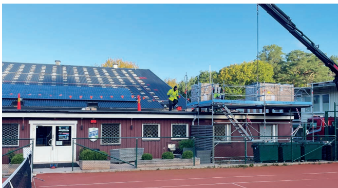
Solceller installeras på taket under hösten 2023