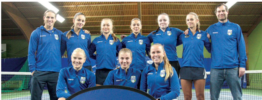
PTBK:s damlag i elitserien.