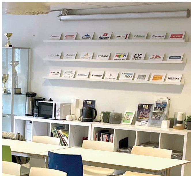
Partnerskyltar i kafét