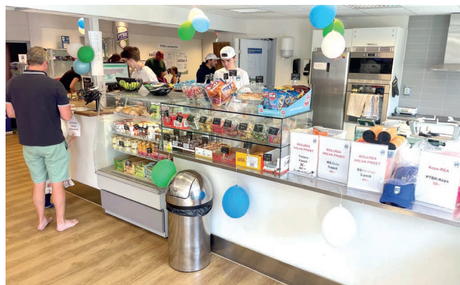
PTBK:s café under familjedagen i juni när klubbens 40-årsfirande.